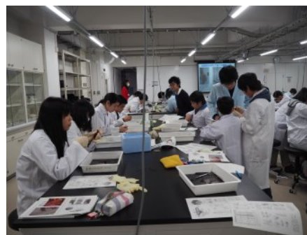
ザリガニの解剖に没頭！