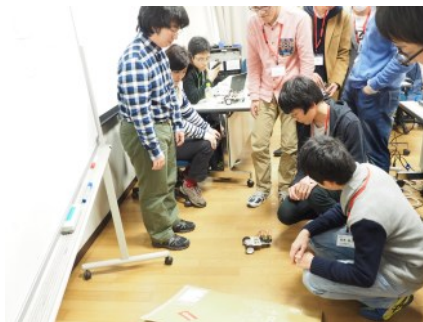
モーターカーは坂を登るか？

最後に、グループワークの口頭発表と懇親会をもって本實習プログラムは幕を閉じました。様々な研究・学習をしている受講生が一堂に会したこの2日間には、若い研究者たち同士が出会い、分野を超えて交流が広がったことでしょう。もしかしたら、ここで生まれた繋がりが未来のおもしろい研究へと結びついていくのかもしれない…そんな期待をしつつ、この報告を結びたいと思います。