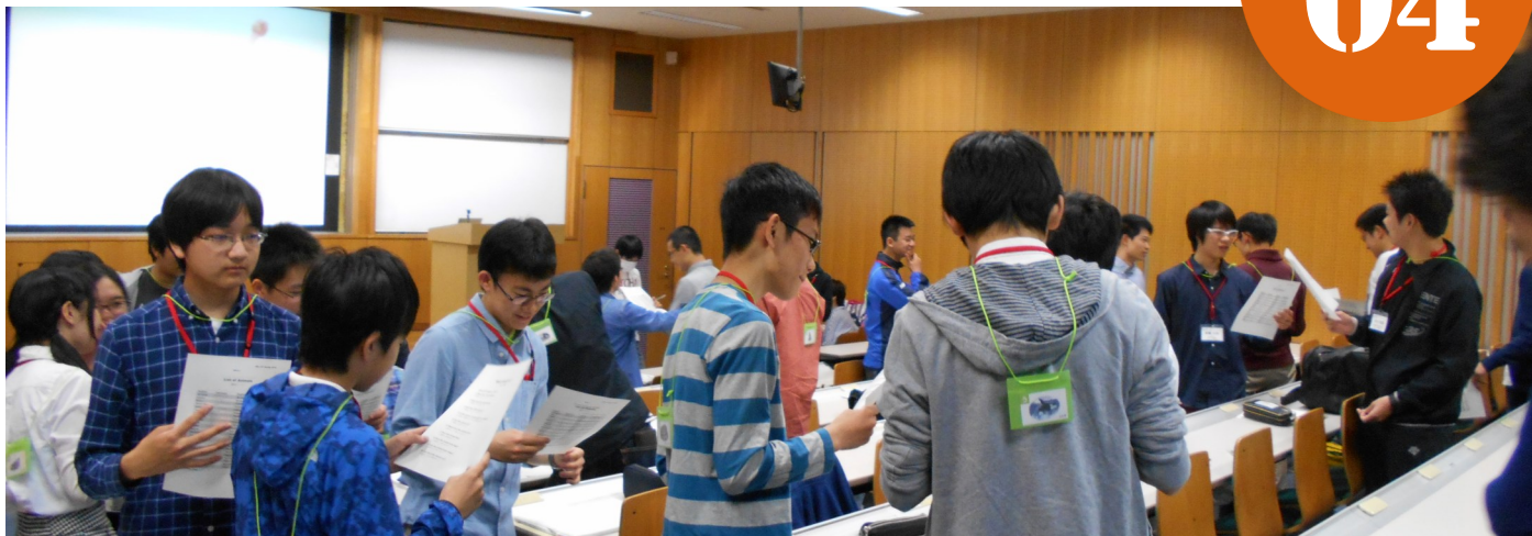
第5回共通プログラムでの英語ゲームの様子。