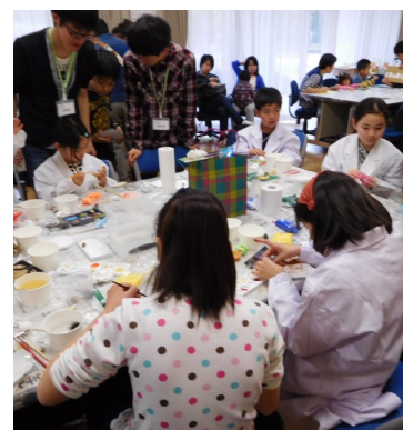
筑波大学下田臨海実験センターがタッチプールを開催していたので、ナマコ、モズクガニ、ウニなどをお借りし、観察しました

ダンゴムシ実験は、子どもはもちろん、大人の方にも多く参加していただきました。ポスター発表も、子どもから大人まで多くの方に聞いていただきました。